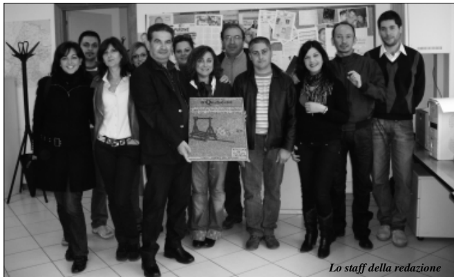
Lo staff della redazione

Un gesto di gratitudine per l'attenzione e l'interesse dimostrato nel corso degli anni verso il comune